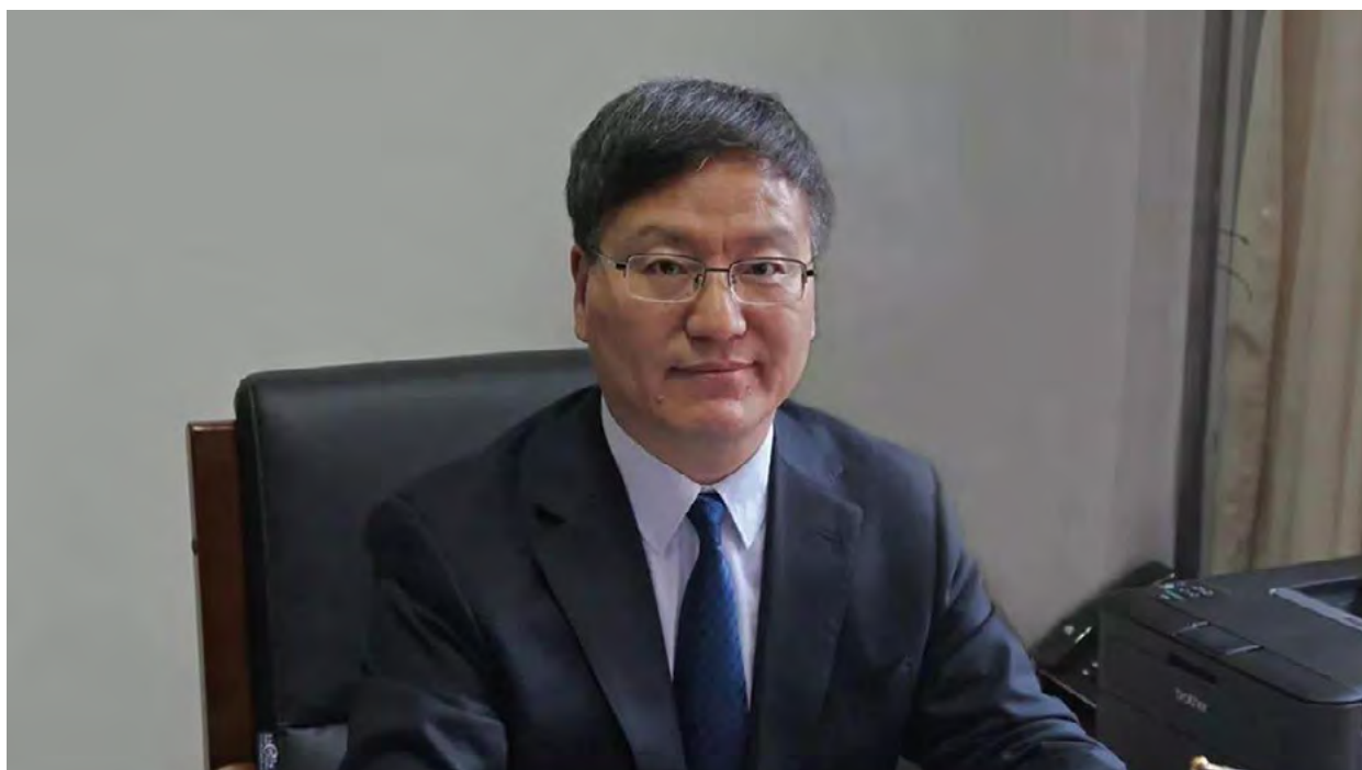
中国教育学会学术委员、教育管理分会副理事长，北京开放大学校长 褚宏启

“双减”政策的实施，使得义务教育生态发生急剧变化，校外培训机构大幅压减，学校普遍提供课后服务，学校布置的作业数量显著减少，学生课外培训负担与过重作业负担总体上大幅减轻，学校、学生、教师、家长、补习机构的关系格局被重新改写。从这个视角看，“双减”成效显著。但同时出现的一些新情况、新问题也不容忽视，如学生在校时间过长，教师负担过重，学校无力支付教师提供课后服务的报酬，课后服务难以可持续发展，某些家长和学生对于学科类培训依然有强烈需求，一些家长对当地减负政策有负面评价等，甚至在某些地区和学校出现了学生学业质量下降、教师职业吸引力下降等情况。