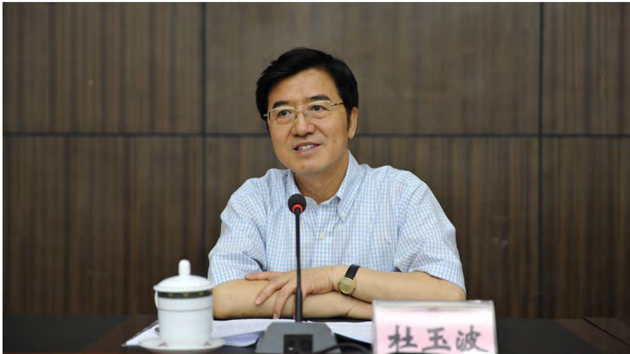
杜玉波 全国人大常委会委员、全国人大教科文卫委员会副主任委员、中国高等教育学会会长

4月20日,十三届全国人大常委会第三十四次会议审议通过新修订的《职业教育法》,于今年5月1日起正式实施。本次修订,可以用12个字来概括——恰逢其时、来之不易、影响深远。恰逢其时,因为修法是贯彻落实习近平总书记关于职业教育重要论述精神,立足新发展阶段、贯彻新发展理念、构建新发展格局,及时将党的主张转化为法律规范和国家意志的重要举措;来之不易,因为修法是在党中央国务院的关心重视下,各方面通力协作、多年努力奋斗的重要成果;影响深远,因为修法对推动职业教育高质量发展,对建设教育强国、人力资源强国和技能型社会具有重大意义。